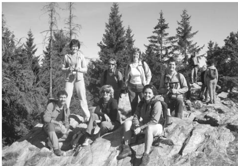
Záříjový výlet do Krkonoš