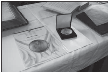
Plaketa Ministerstva obrany pro Kunvald

„Může se zdát, že téma válečného hrdinství patří minulosti, ale není to vůbec pravda. I dnes čeští vojáci nasazují svůj život na zahraničních misích, kde bojují za klidný život lidí v naší zemi. A bohužel i umírají.