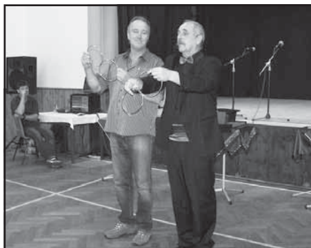
Možná...přišel i kouzelník