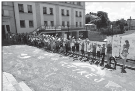
Olympijský běh v kunvaldské škole

Ve středu 22. června odstartoval v rámci T-Mobile Olympijského běhu 2016 na mnoha místech i v Kunvaldì prostřednictvím Českého rozhlasu Radiožurnálu v 18.00 T-Mobile Olympijský běh. Na všech závodech po celé České republice vyběhlo celkem 52 547 účastníků. Běh byl hlavně charitativní akcí při které účastníci část ze startovného věnovali na Olympijskou nadaci. Olympijská nadace pomáhá sportovat dětem ze sociálně znevýhodněných rodin, kterým na sport dětí chybí peníze.