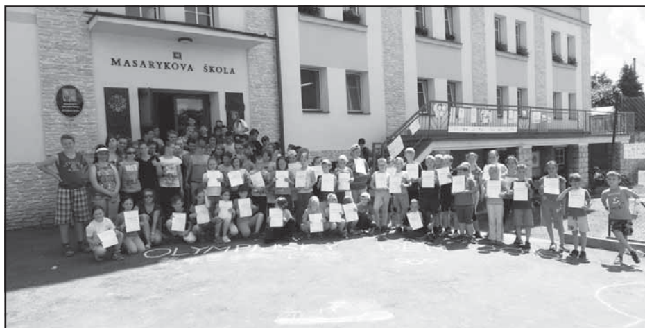
Olympijský běh v kunvaldské škole

mohli doplnit připravenými melouny, klobásami a různými nápoji.