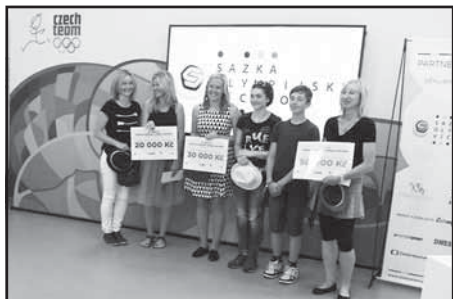
Sazka olympijský vícebój - při předávání ceny v Praze