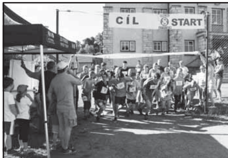
Olympijský běh v Kunvaldì

U nás byly připraveny tři trasy pro děti do 10 let 760 metrů, kde běželi nejmenší účastníci i se svými rodiči, další pro děti do 15 let 1600 metrů a pro dospělé 6700 metrů. Nejdelší trasa vedla směrem na Končiny lesem přes Bubnov a zpět k sokolovně. Velice nás překvapila účast. V obou dětských kategoriích vyrazilo dohromady 45 natěšených závodníků a závodnic. Do cíle většinou dobíhali s rozzářeným úsměvem, i když i nějaká ta slzička ukápla. Dospělých vyrazilo celkově 35.