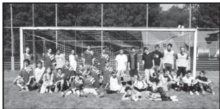
Fotbalové utkání mezi Kláštercem a Kunvaldem