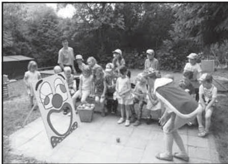
Setkání dětí s králem Karlem IV.

Mezinárodní den dětí letos proběhl v MŠ dne 2. 6. v odpoledních hodinách. Sám král a císař Karel IV. přišel z minulosti za našimi dětmi až do ložnice, kde je mile probudil. Velmi se podivil, že i po 700letech mají děti stále jen dvě ruce a dvě nohy, jednu hlavu, jeden pupík. Děti mu ukázaly, jak se umí samy obléci