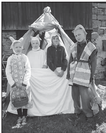
Z pohádky do pohádky

Mirka Celerová