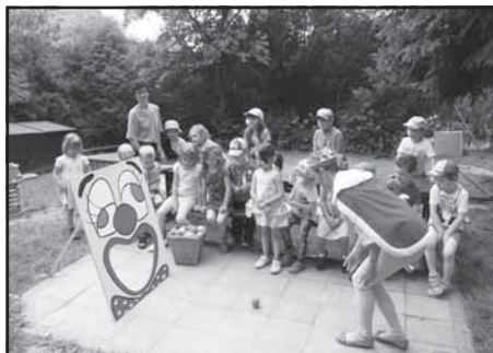
Setkání dětí s králem Karlem IV.

Mezinárodní den dětí letos proběhl v MŠ dne 2. 6. v odpoledních hodinách. Sám král a císař Karel IV. přišel z minulosti za našimi dětmi až do ložnice, kde je mile probudil. Velmi se podivil, že i po 700letech mají děti stále jen dvě ruce a dvě nohy, jednu hlavu, jeden pupík. Děti mu ukázaly, jak se umí samy obléci