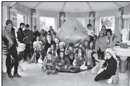
Děti na pracovním výjezdu do Spolkové republiky Německo

Bylo velmi zajímavé pozorovat české a německé žáky při práci, neboť jejich snaha