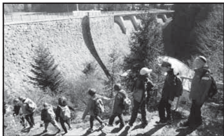
Děti ze ZŠ na výletě u Pastvinské přehrády

Přešli jsme lesy a louky, cestou byl krásný rozhled po okolí a dorazili jsme do Klášterce. Prošli jsme jako husy za sebou přes pole s řepkou a už jsme se ocitli na Končinách. Na cestě jsme si zahráli ragby s flaškou. Chudák flaška nakonec byla pěkně zmordovaná, ale dobře využítá k recyklaci. Na louce na kraji lesa jsme si zahráli Skatulata hejbejte se a Mrazíka, moc nás to bavilo. Pokračovali jsme přes les směr škola, tam nás paní učitelky propustily a všichni jsme šli domů. Ačkoliv byl někdo unavený, všechny nás tento den bavil.