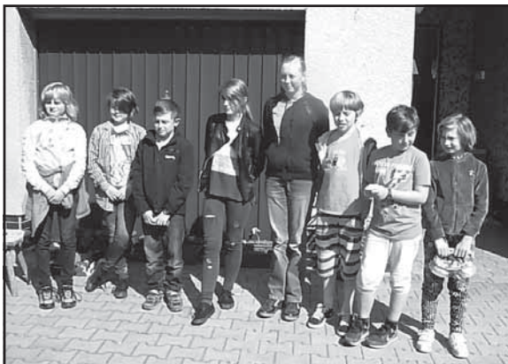
Účastníci základního kola soutěže Zlatá srnčí trofej

Smekám před znalostmi našich dětí a moc gratuluji k dosaženým úspěchům. Velké podě-