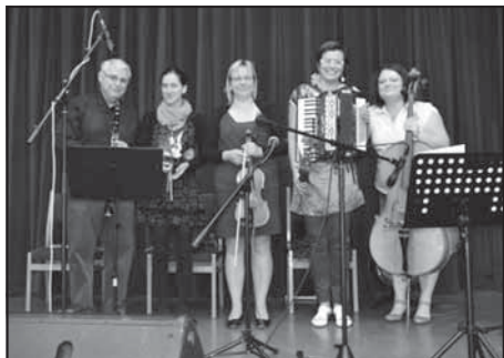
Z koncertu v Týništi nad Orlicí