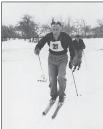
Z lyžařských závodů dne 9. 4. 1944