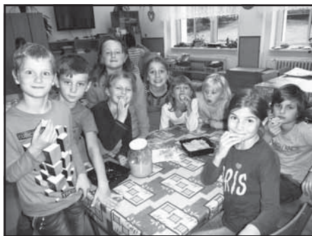
Jablka a děti ve školní družině