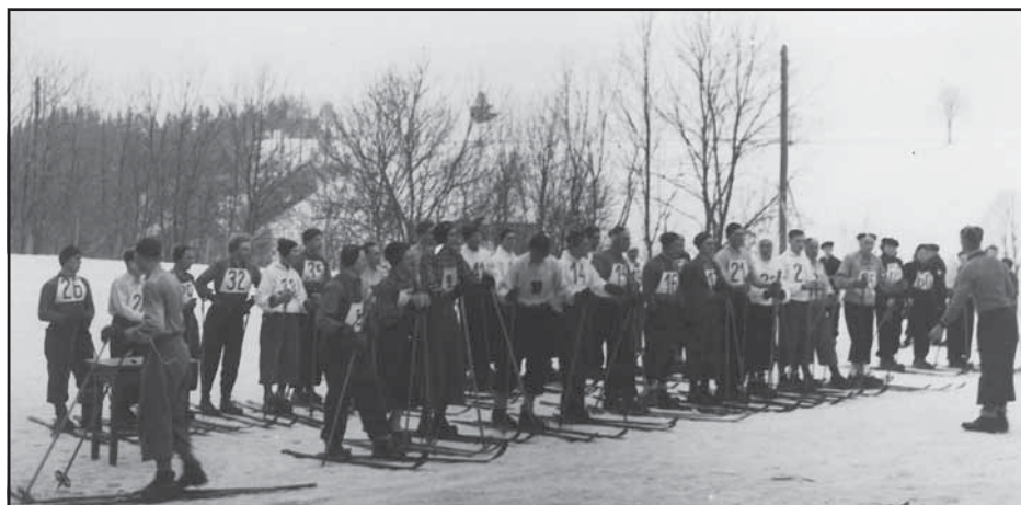
Historická fotografie z přílohy Kunvaldské kroniky – Z lyžařských závodů v Kunvaldě v roce 1941