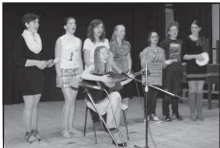
Vystoupení kunvaldských dětí na setkání duchodců

Co se v Kunvaldě podařilo udělat, co by se mohlo ještě v tomto roce stihnout, vše nám řekl náš pan starosta. Jistě nás mimo jiné potěšila zpráva, že “Kampelička” se vrací po majetkové stránce zpět do lůna obce a objekt bude díky své dostupnosti sloužit snadnějšímu žití nás všech.