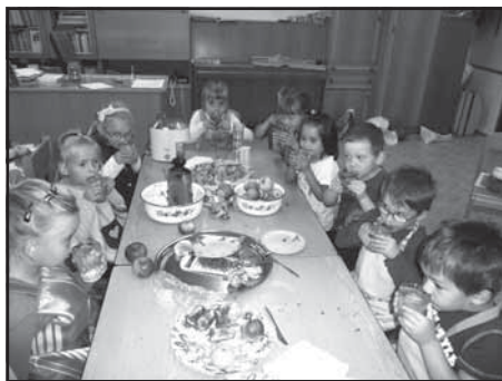
Polytechnické vzdělávání – zpracování jablek v mateřské škole