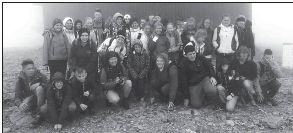
Na výletě v Krkonoších s partnerskou německou školou a na Sněžce

Krajina se dětem velmi líbila, proto většina natáčela videosekvence anebo fotografovaly, aby se mohly o krásu Krkonoš podělit s rodiči. Čím výš jsme se přibližovali k vrcholu hor, tím méně jsme viděli kvůli husté mlze. Na Sněžce jsme se vyfotili s německými žáky a pokračovali v sestupu po červené turistické značce. Na rozcestí jsme odbočili na modrou turistickou značku a pokračovali směrem k Luční Boudě, která v různých obměnách existuje již od 17. století. Zde jsme se nasvačili, prohlédli si pramen Úpy a Bílého Labe a potom se vydali k chatě Výrovka, kde si děti daly čaj, horkou čokoládu, někdo i polévku, ale hlavně jsme si odpočinuli a nabrali síly. Při této etapě cesty se již naši žáci spřátelili s německými a o zábavu bylo postaráno. Komunikovali v německém, anglickém jazyce