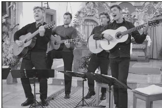
Guitar4mation s nadšením a plným nasazením.