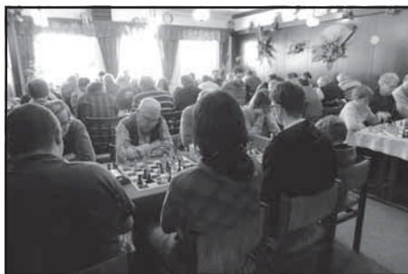
Sál Kunvaldského penzionu U Lípy plný šachistů - to se jen tak nevidí

Celodenní turnaj se odehrál již tradičně v Penzionu U Lípy, který je zapojený do pro-