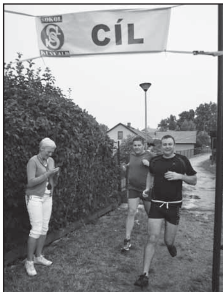
Běžci - železní muži v cíli

Výstřel poslal železného muže a ženy dne 25. 7. 2015 do příjemně vyhráté požární nádrže. A už bylo slyšet pouze povzbuzování a šplouchání vody. Počasí nám velmi přálo, palčivě horké dny dokázaly ohřát naši vodičku na příjemných 23 stupňů Celsia. Po uplavání 500 metrů vyběhli „železníci“, z vody a naskočili na svá kola. Slápli do pedálů a směřovali směrem Klášterec nad Orlicí, Pastviny, Lišnice a odsud směr Kunvald. Trasa je dlouhá 23 km, řeknete si, to není moc, ale připočteme-li převýšení, hned na začátku trasy je skoro 100 m nadmořské výšky, je to pro spoustu účastníků náročné.