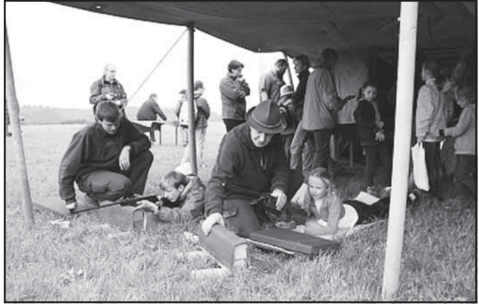
Zlatá srnčí trofej 2015 – Říčky – střelba ze vzduchovky

V pátek 22. 5. 2015 se konalo Okresní kolo soutěže Mladý zahrádkář v kunvaldské škole. Zúčastnila se za mladší kategorii 3 děvčata z Kunvaldu, 2 žáci z Líšnice, 4 žákyně z Lukavice a 2 žáci z Klášterce nad Orlicí. V kategorii starších bojovala pouze 3 děvčata z Kunvaldu. Na soutěži bylo přítomno 10 hostů, nechyběl pan starosta Kunvaldu, paní starostka