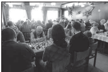
Sál Kunvaldského penzionu U Lípy plný šachistů - to se jen tak nevidí

Celodenní turnaj se odehrál již tradičně v Penzionu U Lípy, který je zapojený do pro-