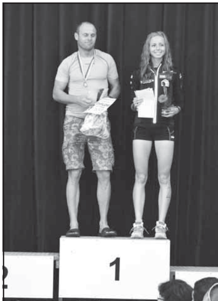
Zaslouženě na stupních vítězů