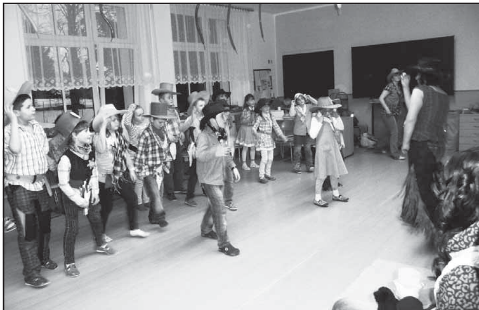
Country mejdan ve školní družině.