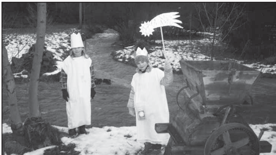
Kampak se ztratil třetí král?

Článek napsaly K. Kavková, A. Šlesingrová a B. Matyášová.