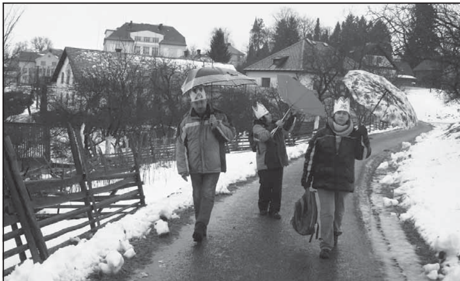
My Tři králové jdeme k Vám...