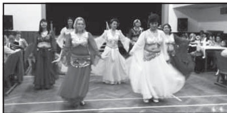
Vystoupení tanečnic z Kameničné

Bříšší tance, atmosféra houstla, já alespoň čekal, až se závěsy rozhrnou a uvidím tu správnou techniku, pohyb svalů a oslavu lidského těla.