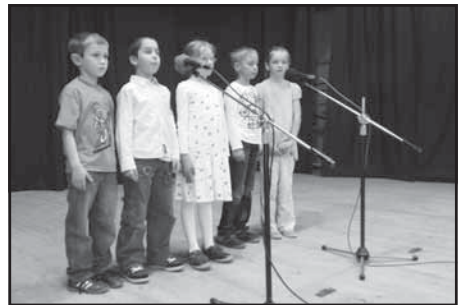
Vystoupení dětí ze ZŠ v Kunvaldě

A začalo zábavné odpoledne. Naši nejmenší, mají úspěch největší, to je klasika - vystoupení dětí z mateřské školky jen potvrdilo pravidlo. Děčka byla úžasná. Vystoupení žáků základní školy bylo hezké a člověka muselo napadnout, jaká trpělivost a láska