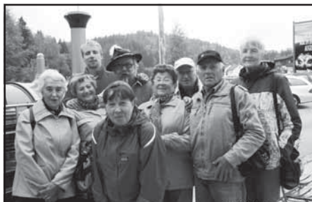
“Stateční” v Srní

Den druhý - společná vycházka k Hauswaldské kapli – počasí fajn, my, kteří odpočívali, vítali jsme u silnice narytálce od kaple. Třetí výlet byl celodenní – Šumava z německé strany, aneb přes Železnou Rudu do Lohbergu. Navští-