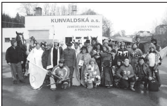
Účastníci masopustního průvodu

Sokol Kunvald tímto mockrát děkuje všem účastníkům masopustu za dar, který