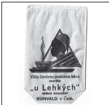
propagační sáček na balení pražené kávy

Propagační sáčky budou zařazeny jako příloha Kroniky městyse.