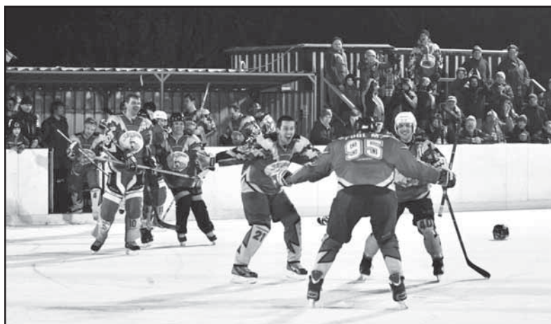
Slámožrouti s fanoušky na ledu