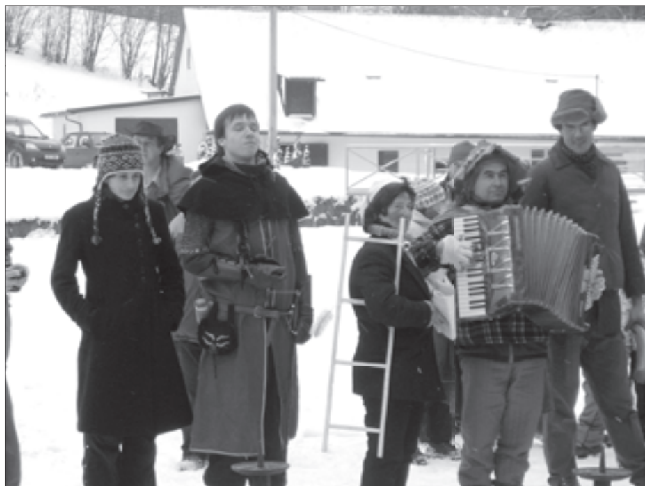
1. masopust v Kunvaldě