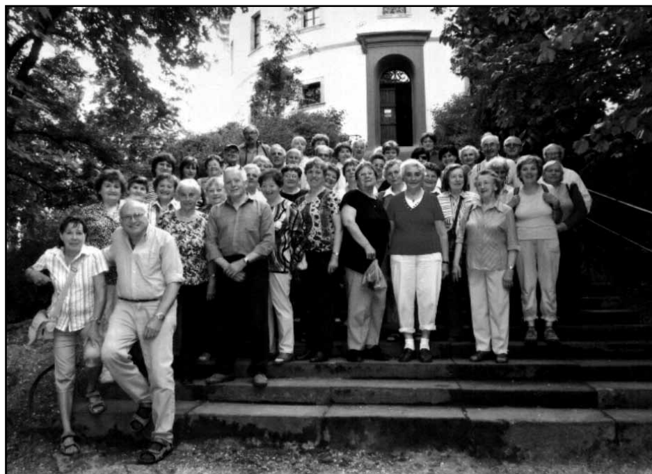
Kunvaldští důchodci před Humprechtem