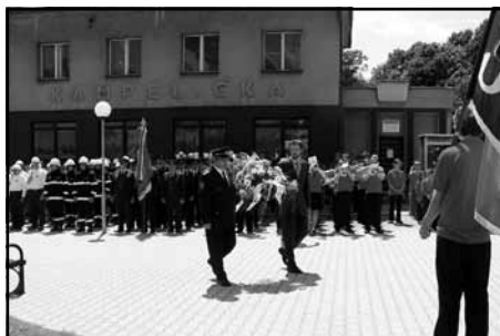
Kladení kytky k Pomníku padlým