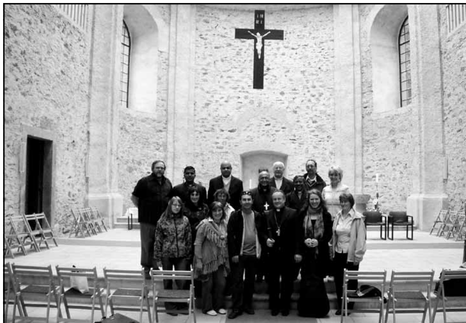
Indičtí biskupové v Neratově