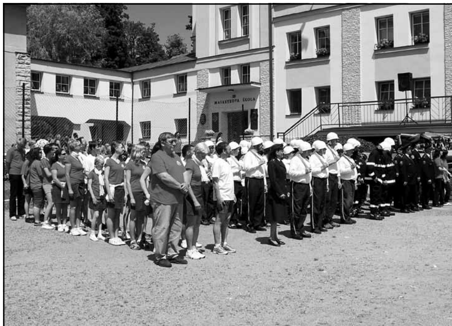
Při zahájení oslav nástup sokolů a hasičů před tribunou