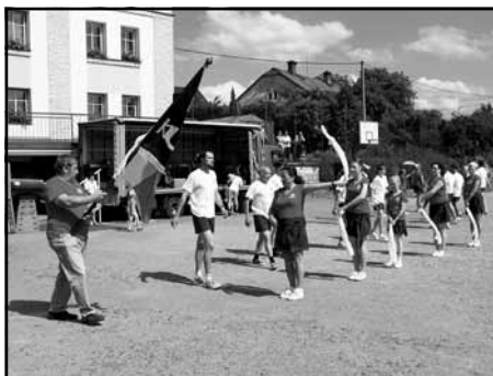
Cvičení kunvaldských sokolů