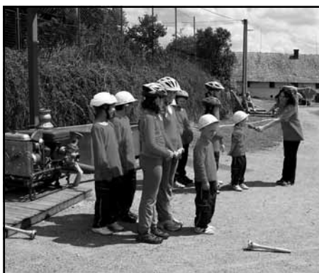
Kunvaldský hasičský dorost

Děkuji jménem Sokola Kunvald všem členům Sokola a jeho příznivcům, kteří pomáhali při průběhu oslav. A to celému ochotnickému souboru, dětem i dospělým, kteří se účastnili všech cvičení, obsluze ve stánku v občerstvení a kolektivu kuchařek ZŠ Kunvald, které připravily občerstvení pro naše hosty.