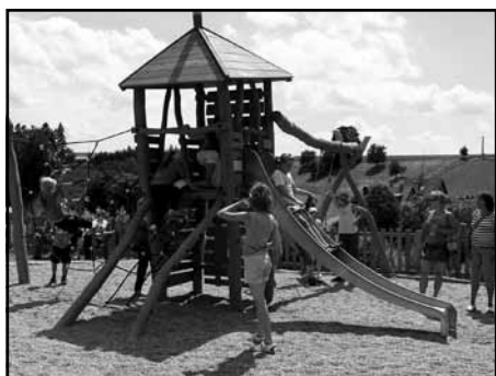
Dětem pro radost