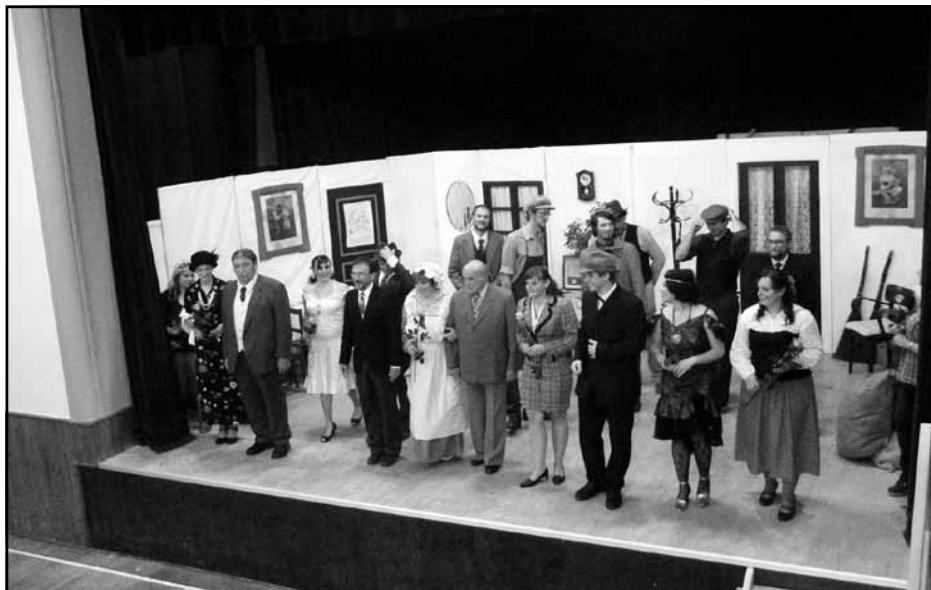
„Děkovačka“ po divadle