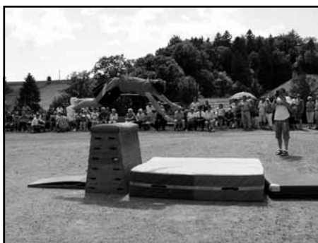
Kunvaldští sokoláci při gymnastice