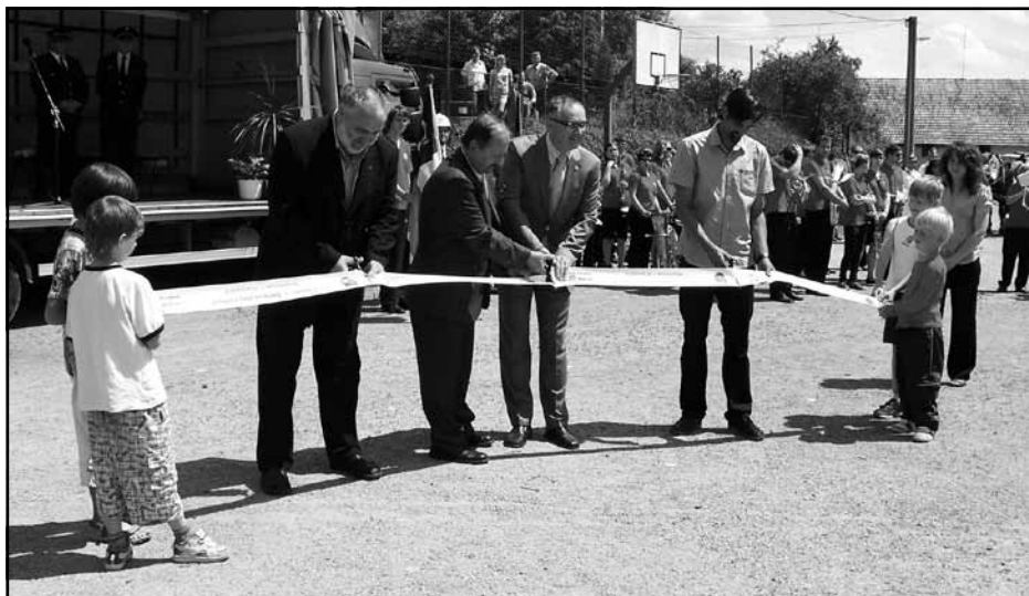
Otevření hřiště Dětem pro radost