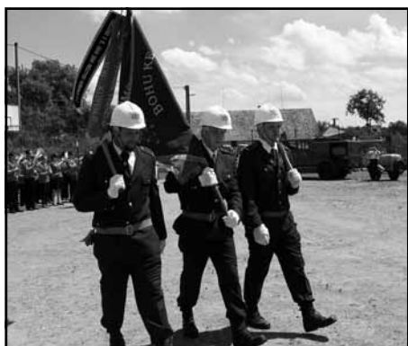
Kunvaldští hasiči se svým praporem