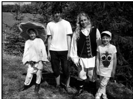
Z pohádky do pohádky - Ivánek a dědeček Hříbeček

Vrátím se teď o patnáct let zpět, když jsme s touto akcí začínali. Tento nápad se zrodil v hlavách dvou paní učitelek, a to Vlasty Šlezingrové a Mily Kalouskové. Tehdy jsme ještě neměli tušení, jak pochod u dětí i rodičů uspěje. V prvním ročníku se sešlo na startu asi 80 dětí. Další již přibývaly až na letošní rekord, samozřejmě podle toho, jak se vydařilo počasí. Začali k nám jezdit účastníci nejen z nejbližšího okolí, ale i Ústí nad Orlicí či z Rychnova nad Kněžnou. Za tu dobu děti, které dřív pochodovaly, další roky již hrály a předváděly pohádky. Vždy bylo 50 - 60 pořadatelů, z toho 2/3 dětí a zbytek dospělých.