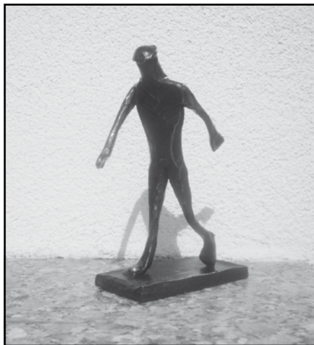
Kunvaldský železný muž