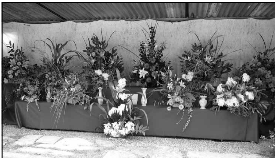
Ze zahrádkářské výstavy