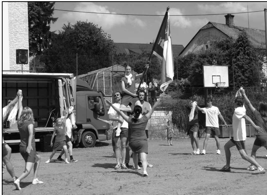
Vzpomínka na 23. 6. 2012