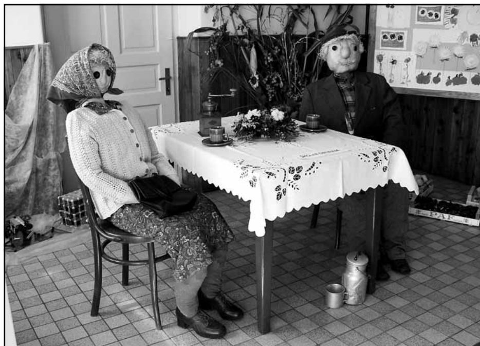
„Dúchodci“ ve vestibulu sokolovny - loutky vyrobily šikovné ruce dětí a paní družinářky z naší školy