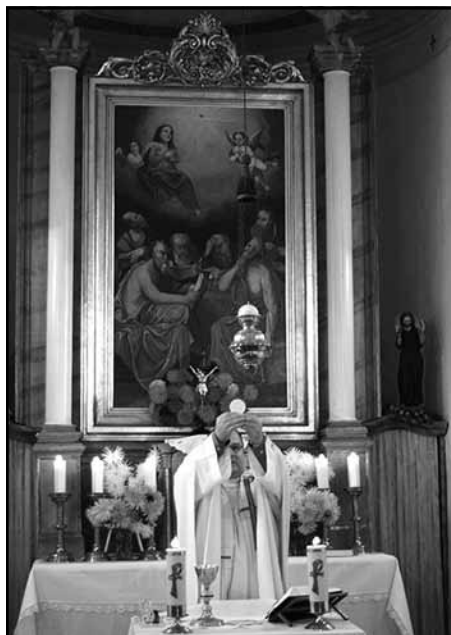
Z poutní mše svaté v „dolní“ kapliče