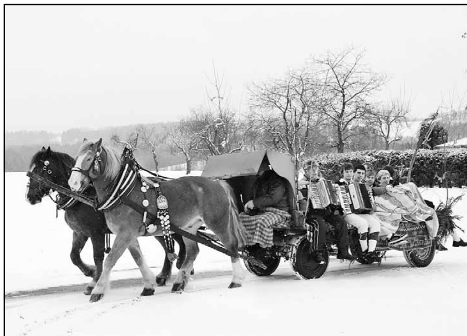
„Krojované“ velikonoce v Kunvaldě – tentokráté bílé, ale i tak veselé a s harmonikou a zpěvem