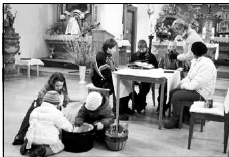
Děti a „Slepice na paprice“

V té praktické šlo o představení konkrétních pěstitelských výsledků dětí a mládeže. Zprvu jsem sice u mládeže nadšený pro zahrádkářskou činnost nezaznamenala, ale recept - slepice na paprice bez