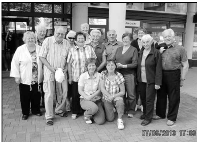
Kunvaldští v Sezimově Ústí