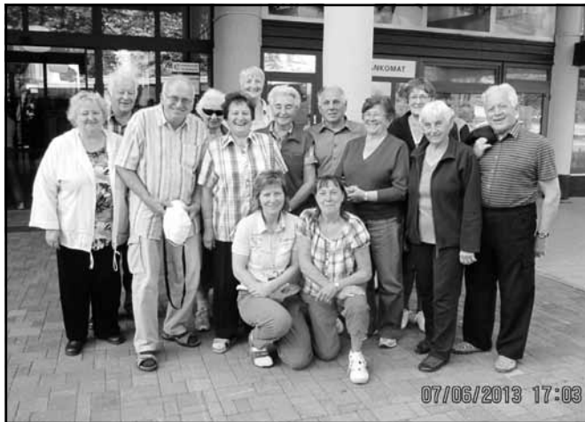
Kunvaldští v Sezimově Ústí