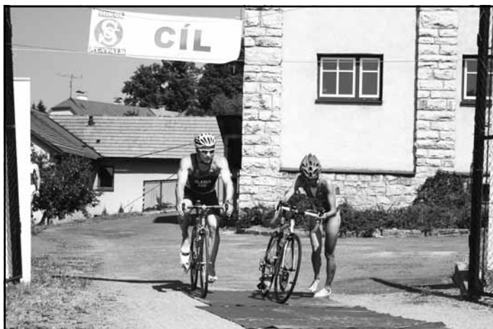
Kunvaldský železný muž - v cíli

Všichni závodníci a závodnice si zaslouží veliký obdiv za dokončení závodu v panujících tropických podmínkách. Děkujeme všem sponzorům a dobrovolníkům, bez jejichž pomoci bychom závod nebyli schopni uspořádat.