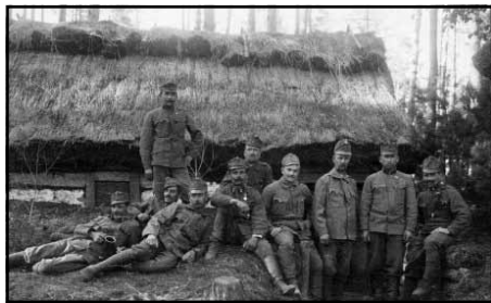
Čs. legionáři v Rusku

...Bylo to po čtvrté, co jsem přišel do Ameriky. Poprvé to bylo, když jsem jel za Miss Garrigue v roce sedmdesátém osmém a dvakrát jsem tam jel přednášet, to bylo v letech 1902 a 1907. Tož jsem viděl Ameriku růst ještě od jejich pionýrských dob. Ano, líbí se mi. Ne že bych měl rád kraj, ten náš je pěknější. Americký kraj je - jak bych vám to řekl? Je to jako americké ovoce, vždycky se mi zdálo, že jeho ovoce chutná nějak syrověji než naše, naše že je sladší a zralejší na chuť. Myslím, že to dělá ta tisíciletá práce u nás, která je za vším. A stejně i ta americká krajina je jaksi syrovější než naše. Americkému farmáři, vyzbrojenému stroji, je půda fabrikou a ne předmětem lásky, jako dosud u nás.