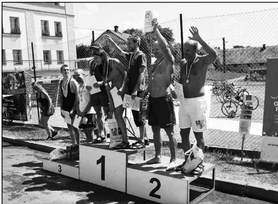
Kunvaldský železný muž - na stupních vítězů