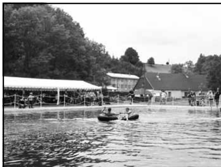
Pohoda na Kunvaldské lávce